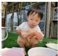
きれいな、色になったよ!