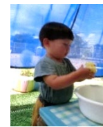
バナナジュースだ