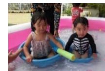
たらいに座って 楽しいな(^^)/