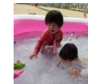
お船が 取れるかな?